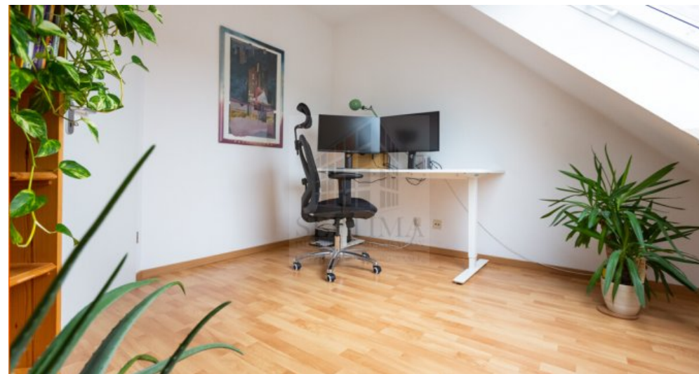
Zimmer obere Etage