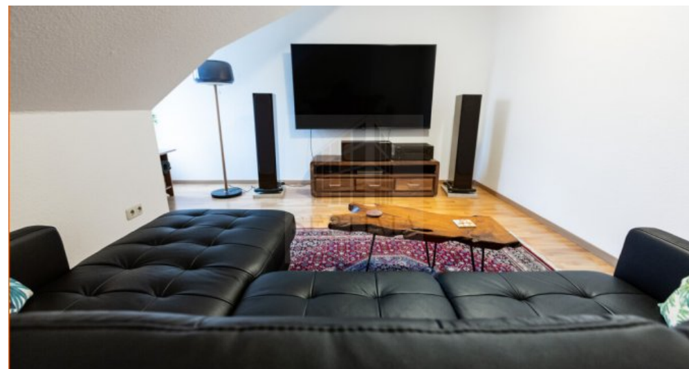
2. Zimmer obere Etage